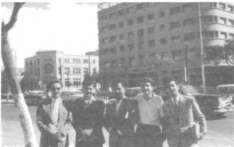
هاوینی ۱۹۵۵ دیمه‌شق